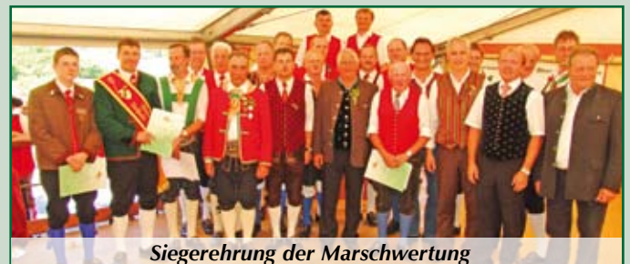
Siegerehrung der Marschwertung