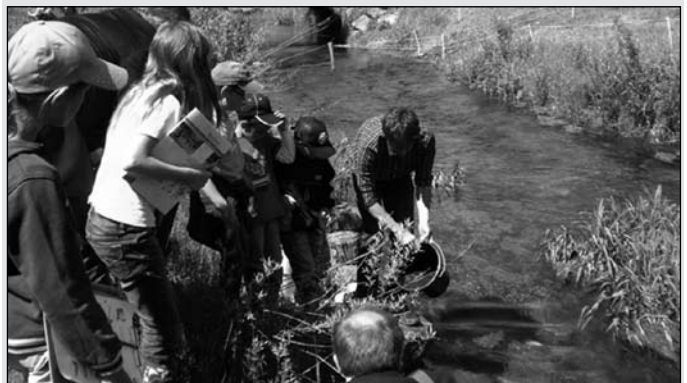
Aussetzen der Bachforellen im Straniger Bach

mit Leben zu erfüllen. Im Rahmen der Wasserschule, einer Aktion des Nationalparks Hohe Tauern, gewannen die Schülerinnen Einblick in die Vielfalt an Wassertieren, die in unseren Gewässern beheimatet ist. Zum Abschluss gab es als Dankeschön für alle Beteiligten noch eine Jause.