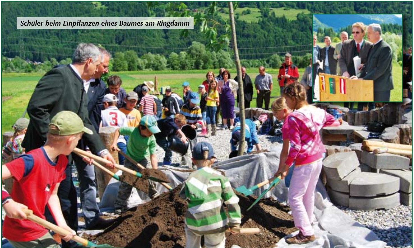
Schüler beim Einpflanzen eines Baumes am Ringdamm

Amtliche Mitteilung • An einen Haushalt • Zugestellt durch Post.at • Erscheinungsort: Kirchbach • Ausgabe 2/2009