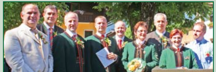
Übergabe der Jubiläumsspende