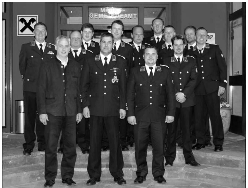
Die neuen Feuerwehrkommandanten der Marktgemeinde Kirchbach

Mit der Einweihung des Ringdammes in Stranig und Fertig-